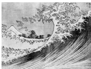
Katsushika Hokusai, Der Berg Fuji mit einem Kuckuck , aus: 100 Ansichten des Berges Fuji , Band 3, Japan 1833–34