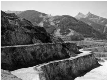
Erzberg, Steiermark, September 2003, Foto: Hans Schabus

5 Heinrich Rombach, Strukturontologie , Freiburg und München 1971, S. 300 f.