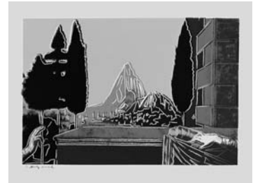
Andy Warhol, Details of Renaissance Paintings (Leonardo da Vinci, The Annunciation, 1472) , 1984, Portfolio von 4 Siebdrucken

Piranesi ging es in seinen Carceri – thematisch im Umkreis von Kerker, Einschluss, Gewicht, Last der Vergangenheit, Erstarrung, Folter, Marter, aber auch Suche, Neugierde und Orientierung entstanden – nicht um perfekte reale Räume wie etwa bei Palladio. Er hatte vielmehr Seelenräume, Psychoarchitektur im Sinn, Räume also, in denen Äußeres und Inneres nicht getrennt sind, sondern eine Verbindung eingehen, die dem Leben nahe kommt. Da Menschen ohnehin und primär in einem permanenten Raum-Zeit-Gemisch und in verschiedenen Wirklichkeitsformen wie Traum, Vision, Realität, Hyperrealität, Unwirklichkeit leben, sind Piranesis Bilder der adäquate Ausdruck für diese Tatsache. Piranesis Kunst ist eine Art Lehrarchitektur. Die kleinen Figuren betrachten staunend die Geschichte und lernen aus ihr. Die Räume sind Durchgangsräume, Gedankenräume, die sich organisch wuchernd fortsetzen wollen. Die Menschen tauchen tief ein in die Vergangenheit, um daraus in die Gegenwart zu gehen, ans Licht: „Durch zahlreiche Treppelläufe wird der Betrachter immer wieder auf endlos langen