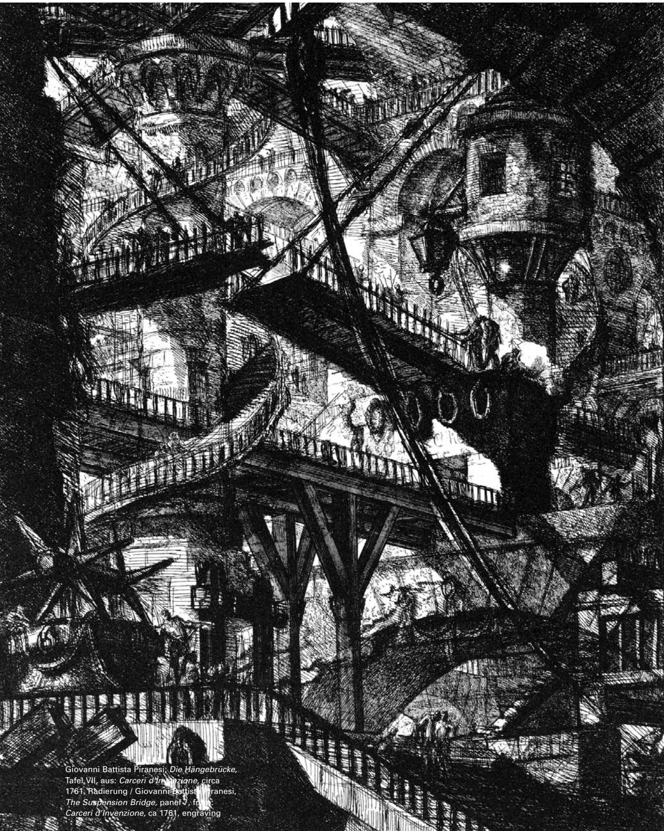
Giovanni Battista Piranesi, Die Hängebrücke , Tafel VII, aus: Carceri d'Invenzione , circa 1761, Rädierung / Giovanni Battista Piranesi, The Suspension Bridge , panel V, from: Carceri d'Invenzione , ca 1761, engraving