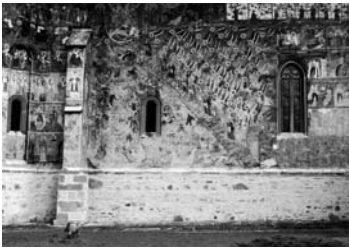
Kloster Sucevita, Rumänien, Juni 2003