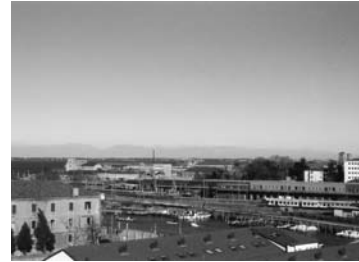
Die Alpen von Venedig aus gesehen, Dezember 2004, Foto: Hans Schabus

Der französische Philosoph Gilles Deleuze hat versucht, das generative Prinzip der Welt des Barock als eine Architektur von Faltungen, Ein- und Ausfaltungen, Krümmungen etc. darzustellen. Bei Leibniz entdeckte er die Lehre vom Falten, einen Operationsvorgang, durch den die Objekte und Subjekte über sich hinausgehen und zu Objektiven und Subjektiven werden – durchzogen und getragen von einem geistigen Abenteuer, dessen Erlebnisfeld die unabschließbare Vielfalt ist. 12